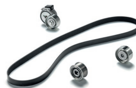
Оригинальные запасные части MAN для системы ременного привода от 2 365 руб. с НДС