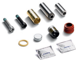
Оригинальные ремонтные комплекты для тормозных суппортов MAN от 4 134 руб. с НДС