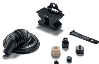
Оригинальные резиновые детали MAN от 969 руб. с НДС