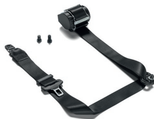
Оригинальные ремни безопасности MAN от 12 067 руб. с НДС