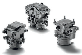
Оригинальные тормозные клапаны MAN от 4 424 руб. с НДС