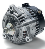
Оригинальные генераторы MAN от 28 784 руб. с НДС