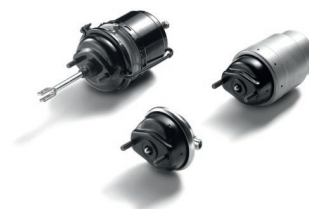
Оригинальные тормозные цилиндры MAN от 10 329 руб. с НДС