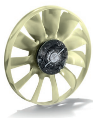
Оригинальные вентиляторы двигателя MAN от 68 239 руб. с НДС